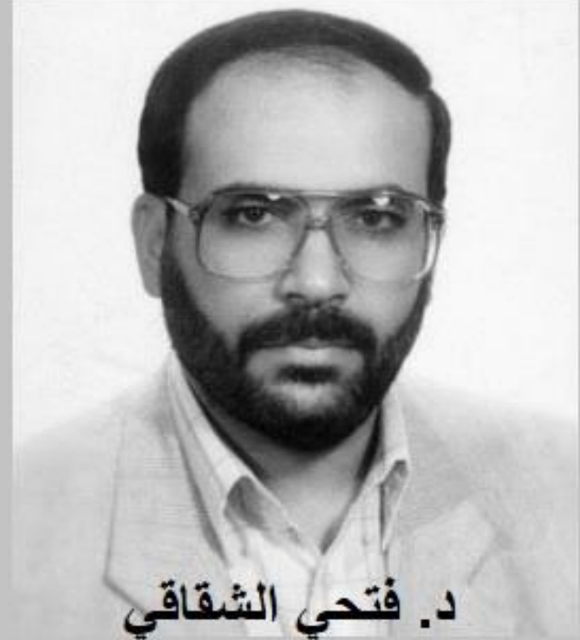
د. فتحي الشقاقي

لا يعرف العشاق أين سيلتقون ، في السجن أم في الموت أم في ظل ورد