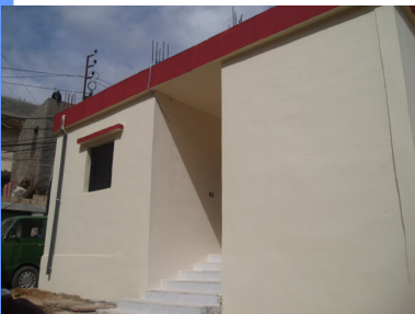
منزل حسن دحويش بعد إعادة تأهيله