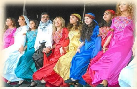
Leuchtende Farben auf die Bühne: Die palästinensische Tanzgruppe „El...